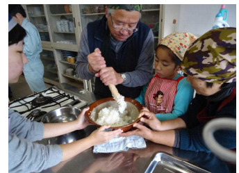
地域の方と一緒に「だまこ鍋」づくり

来年度は設立して5年目を迎えます。多くの地域の皆さんに西高の農場を活用していただき、農を楽しみ、農に親んでもらえるような活動計画を立てました。